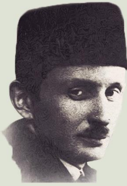
Ömer SEYFETTİN (1884-1920)

Değerlerimizden biri de büyük hikâyecimiz Ömer SEYFETTİN'dir. Ömer Seyfettin Kabataş Erkek Lisesinde 1914'te başladığı edebiyat öğretmenliğini 1920'deki vefatına kadar sürdürmüştür.