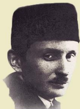
Ömer Seyfettin (1884-1920)

Değerlerimizden biri de büyük hikâyecimiz Ömer Seyfettin'dir. Ömer Seyfettin Kabataş Erkek Lisesinde 1914'te başladığı edebiyat öğretmenliğini 1920'deki vefatına kadar sürdürmüştür. Milletimizin var olma mücadelesi verdiği bu altı sene içinde, Kabataşlı gençlere ve doğal olarak Türk gençliğine ümit, şevk, azim ve güven aşılamıştır. Onun hatırasını yaşatma amacı güden Ömer Seyfettin Öykü Yarışması da bugünün Kabataşlıları olarak bize düşen onurlu bir sorumluluğun meyvesidir.